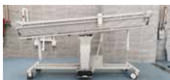
左右均可倾斜，方便老人沐浴