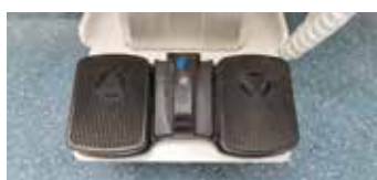
脚踏升降，更好的护理老人