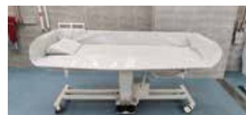
护栏可折叠，方便老人转移到推床上